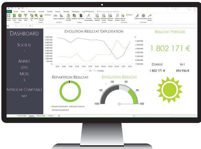
Dashboard du Résultat d'exploitation